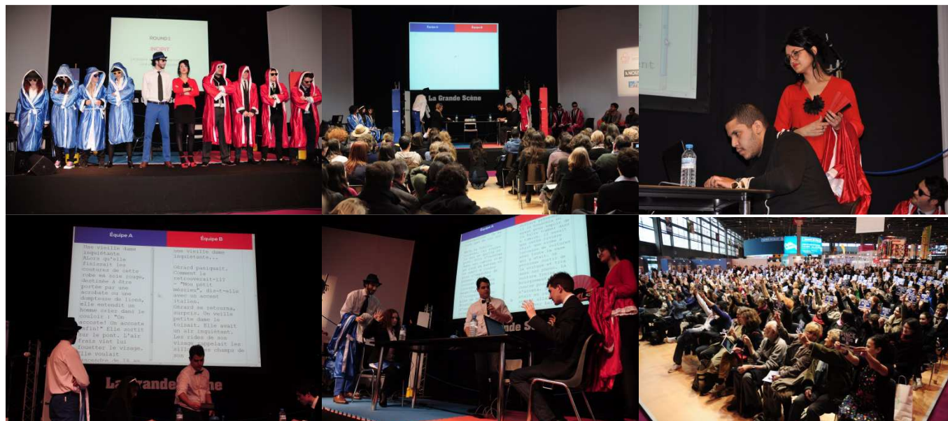
Salon du livre, Paris, mars 2013

Le K.O. des Mots est une création originale de AD 2 Productions. Retrouvez aussi Les ATELIERS du K.O. des Mots avec des ateliers de formation et des spectacles « junior » et « adulte ».