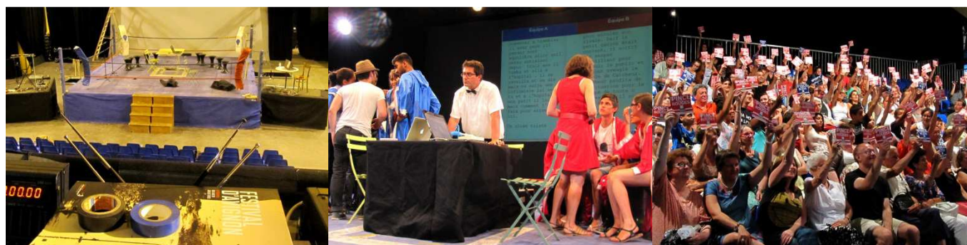
Festival d'Avignon 2013, Programmation IN

Le K.O. des Mots est une création originale de AD 2 Productions. Retrouvez aussi Les ATELIERS du K.O. des Mots avec des ateliers de formation et des spectacles « junior » et « adulte ».